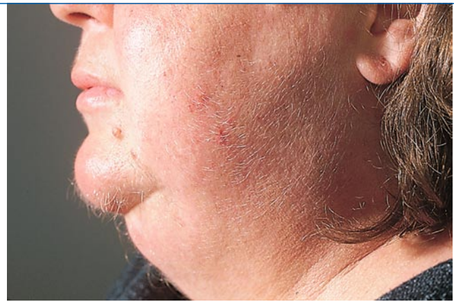
Abb. 4 ▶ Hypertrichose des Gesichts bei Hyperkortizismus

Die Bedeutung von Wachstumshormon (GH, Somatotropin) für die Haare wird ersichtlich aus der klinischen Beobachtung von Zuständen mit vermindertem bzw. vermehrtem GH. GH wirkt indirekt, indem es an den GH-Rezeptor bindet, der ein Transkriptionsfaktor ist und die Expression von IGF- („Insulin-like-Growth-Factor“-)1 erhöht. Dieses wiederum bindet an seinen Rezeptor IGF1-R, der ebenso ein Transkriptionsfaktor ist. Ist der GH-Rezeptor durch Mutationen verändert, dann sprechen die Zellen vermindert auf Somatotropin an. Man bezeichnet dies als Somatotropin-Resistenz oder Laron-Syndrom. Neben einem proportionierten Minderwuchs, der im Kleinkindalter manifest wird, zeichnet sich das