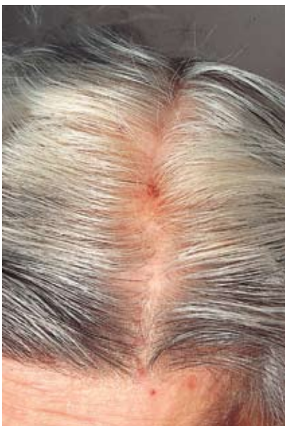
Kratzexkoriationen des Skalps