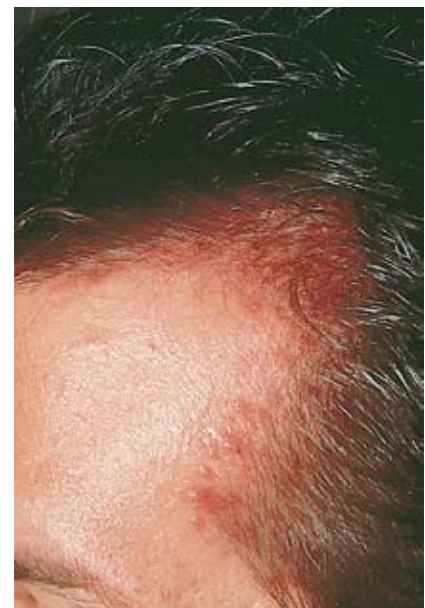
Follikuläre Entzündung am Skalp