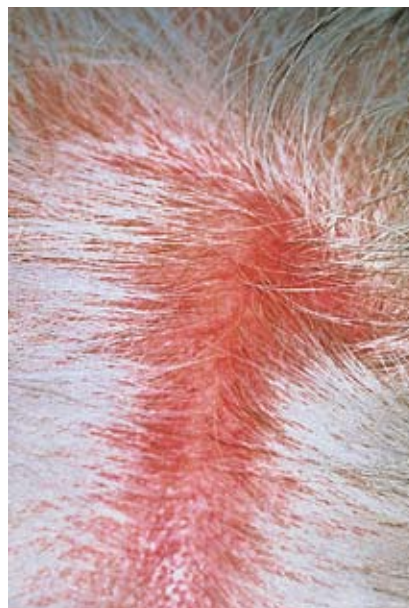
Skalpteleangiektasien beim Red Scalp Syndrom